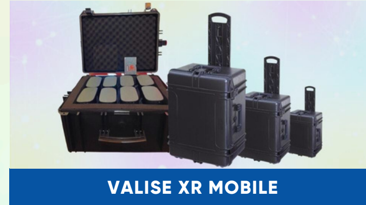
VALISE XR MOBILE