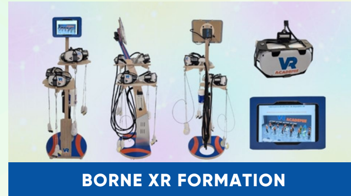
BORNE XR FORMATION